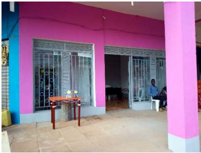
De nieuwe Lumi winkel