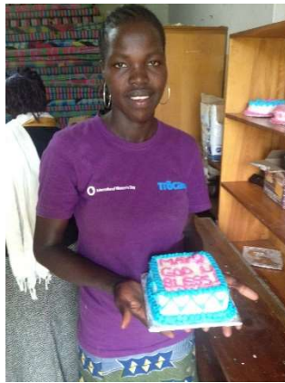
Eén van de vrouwen laat haar zelfgebakken taart zien

De bakgroep heeft geleerd om brood, cake en taarten te bakken en ze kunnen nu bijna zelf aan de slag. De laatste trainingen zullen deze maand plaatsvinden en dan gaan de acht vrouwen in de groep hun lekkernijen zelf op de markt verkopen. Een gedeelte van de opbrengst zal worden gebruikt om de lening terug te betalen.